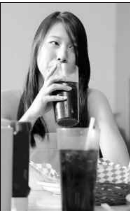
Une seule canette de boisson gazeuse contient 150 calories.

Au lieu de consommer régulièrement ces boissons, rappelons-nous qu'il existe un moyen très simple, économique et bon pour la santé d'étancher la soif : boire de l'eau!