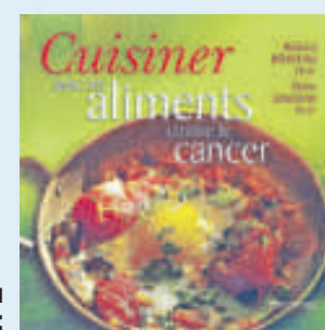
Tiré du livre:

Des molécules du basilic interfèrent dans la croissance des cellules cancéreuses