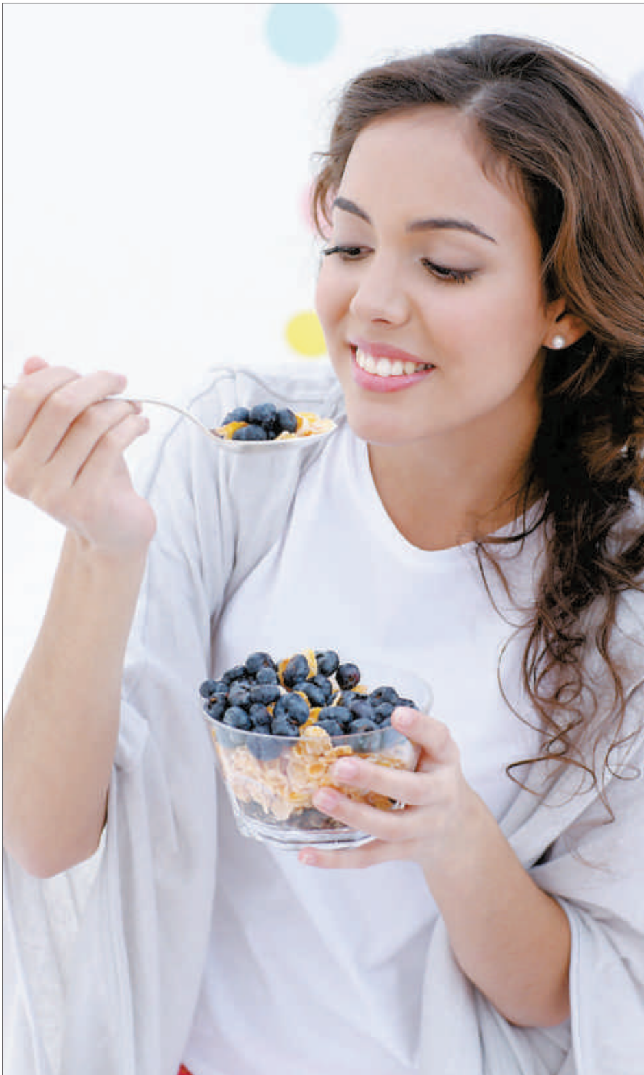
■ En plus d'être bons, les bleuets aident à prévenir certains cancers du sein.

Les bleuets représentent une source exceptionnelle de composés phytochimiques anticancéreux capables d'interférer avec la croissance et le potentiel invasif de plusieurs types de cellules cancéreuses. Dans le but de déterminer si ces molécules pouvaient bloquer la progression des cancers du sein triples négatifs, des chercheurs américains se sont penchés sur l'impact d'un extrait de bleuets sur les propriétés d'invasion de cellules MDA-MB-231, une lignée dérivée de cancer du sein n'exprimant aucun récepteur d'œstrogène, de progestérone ou d'EGF (1). Ils ont tout d'abord observé que l'ajout de cet extrait aux cellules bloquait complètement leur prolifération et leur capacité à se déplacer en réponse à des stimuli procancéreux. Plus intéressant encore, les chercheurs ont montré que