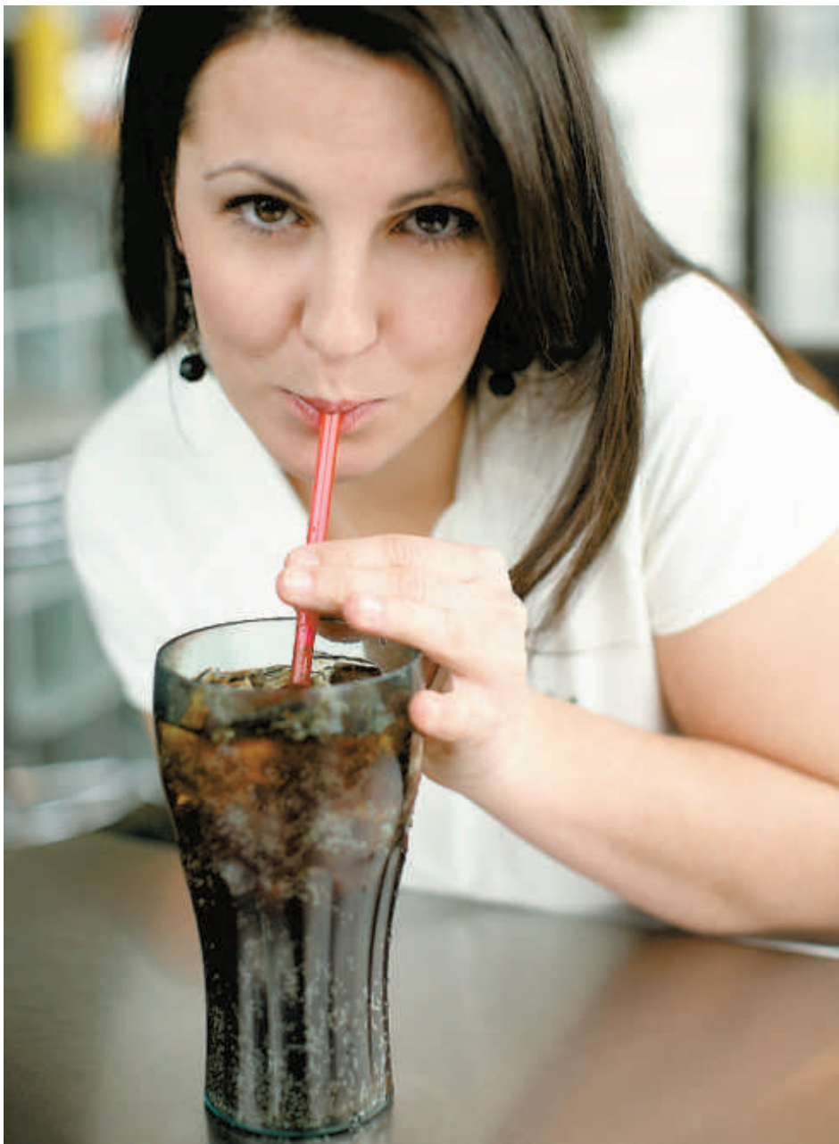
■ Le sucre contenu dans les aliments industriels, comme les boissons gazeuses, favorise le développement du cancer du pancréas.

Plus de 80 % de cet apport excédentaire provient du sucre qui est ajouté de façon artificielle aux aliments industriels, les boissons gazeuses par exemple, le plus important étant le sucrose (le sucre de table) et le sirop de maïs enrichi en fructose (SMEF). Ces sucres sont dans les deux cas formés par l'assemblage d'une molécule de glucose et d'une molécule de fructose : ainsi, ce que l'on appelle sucrose est un sucre composé de 50 % de glucose et de 50 % de fructose, alors que le SMEF contient quant à lui 45 % de glucose et 55 % de fructose. Même si, récemment, l'industrie a adopté en bloc le SMEF comme agent sucrant à cause de sa grande disponibilité et de son faible coût, ces deux sucres sont néanmoins très similaires et entraînent dans les deux cas l'absorption massive de glucose et de fructose par les cellules de l'organisme.