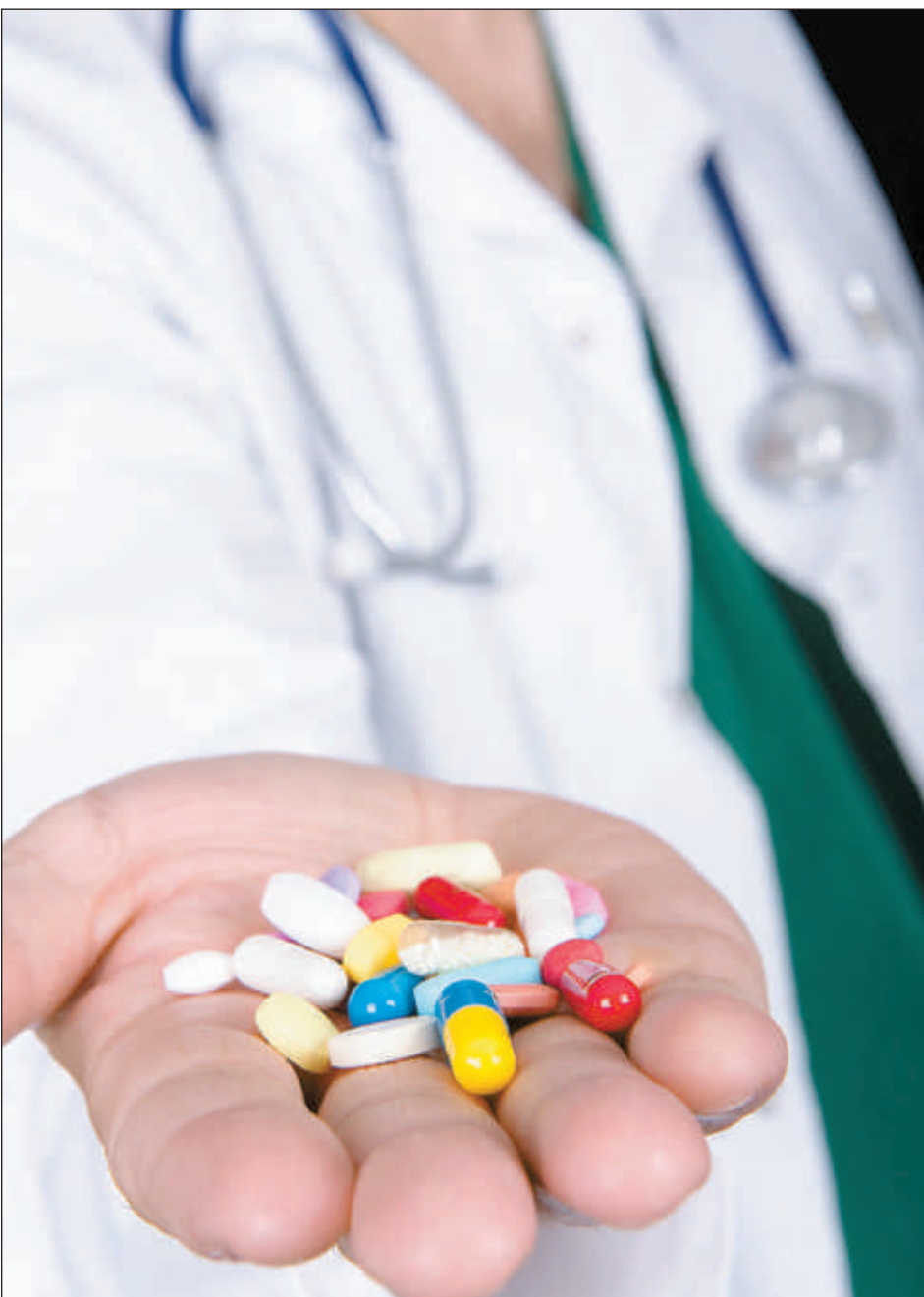
■ L'effet placebo peut se manifester même lorsque les patients sont tout à fait conscients de l'absence de médicament.

On a longtemps pensé que l'effet placebo était observé seulement lorsque le patient ne sait pas que le médicament qui lui est administré ne contient aucun ingrédient actif. Des résultats récents obtenus par des chercheurs de l'Université Harvard suggèrent cependant que l'effet placebo peut se manifester même lorsque les patients sont tout à fait conscients de l'absence de médicament (1) . Les chercheurs ont recruté 80 personnes touchées par le syndrome du côlon irritable (une maladie caractérisée par des douleurs abdominales fréquentes ainsi