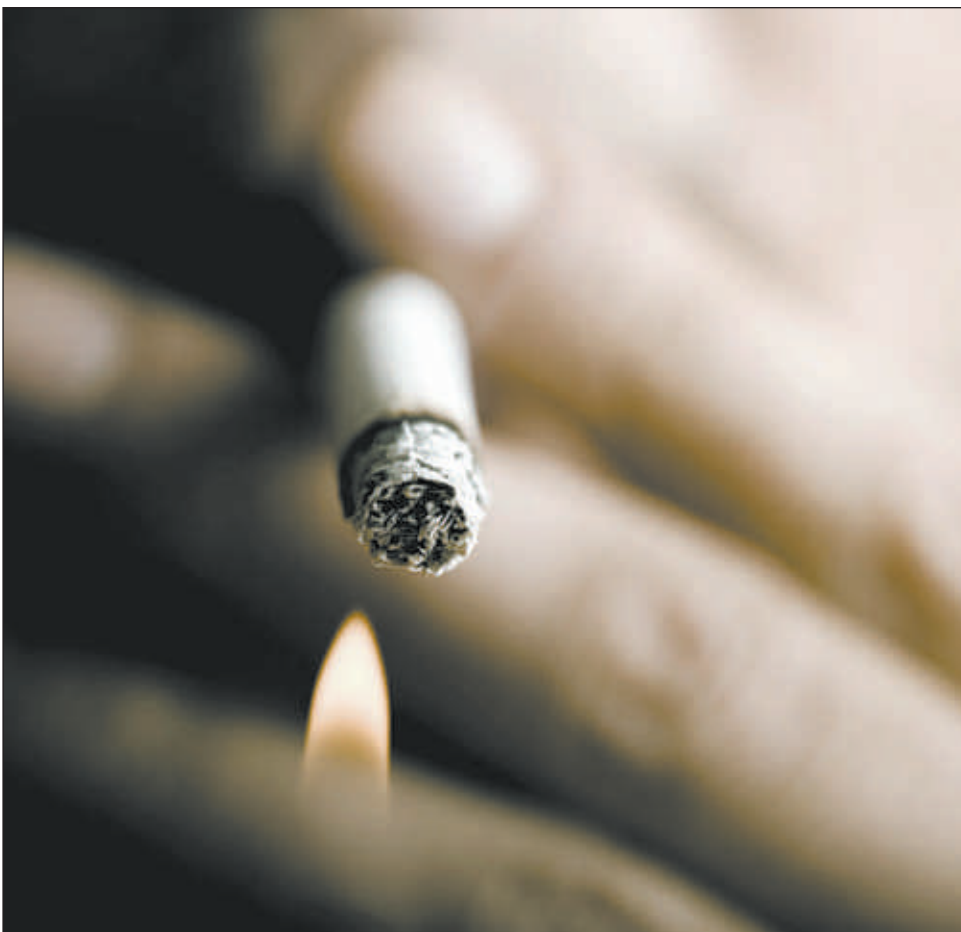
■ Des études récentes ont démontré que les fumeurs réguliers ont cinq fois plus de risques de développer un cancer de la vessie que les non-fumeurs.

L'existence d'un lien étroit entre la du-